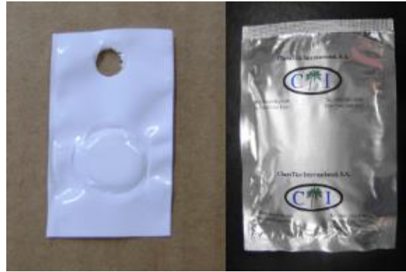
Trampas de superficie